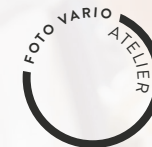
FOTO VARIO ATELIER im Rheingauviertel

Instagram: FOTOVARIOSTUDIO Facebook: FOTOVARIOSTUDIO