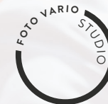
FOTO VARIO STUDIO 1 & STUDIO 2 im LuisenForum

Kirchgasse 6 65185 Wiesbaden T +49 (0)611 – 696 669 68 team@fotovariostudio.de fotovariostudio.de